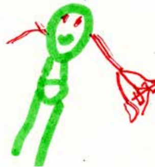
Le méchant vampire