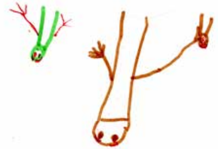
Le vampire attaque l'enfant avec ses griffes.